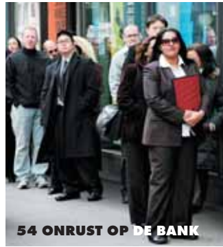
54 ONRUST OP DE BANK