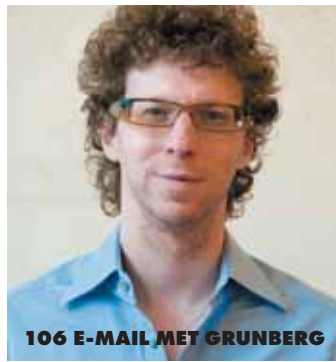
106 E-MAIL MET GRUNBERG