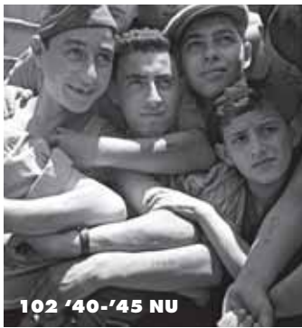
102 '40-'45 NU